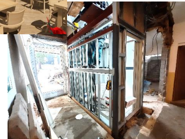
Tady bude výtah