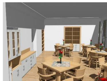
Jak bude vypadat jídelna

Předpokládáme, že z velké části budou poskytované odlehčovací služby sloužit seniorům, a proto se snažíme všechny prostory a vybavení přizpůsobovat jejich specifickým potřebám. Snad se to vše podaří a Odstrčilova vila bude další dlouhá léta dobře sloužit. Jana Lexová